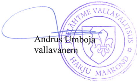
Andrus Umboja vallavanem